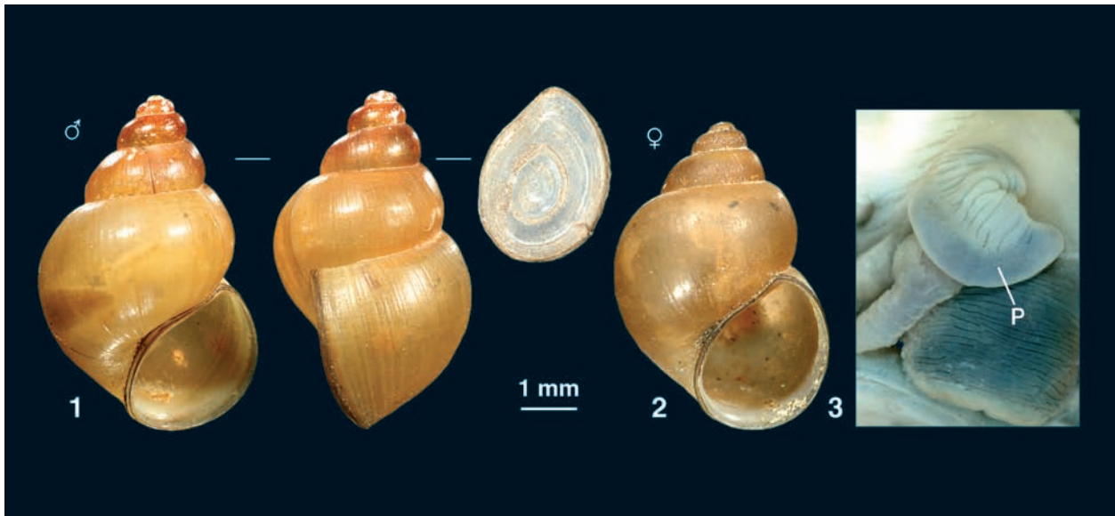
Abb. 5. Pseudobithynia amiqensis n. sp. 1: Holotypus (H = 10.3 mm), 2: Paratypus (H=9.3 mm), 3: Penis.