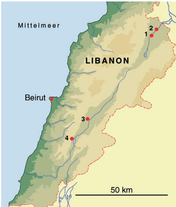
Abb. 1. Die Fundorte von Pseudobithynia kathrini n. sp., P. levantica n. sp. und P. amiqensis n. sp. – 1: Ras el Assi (Prov. Bekaa, Libanon), 2: El Hermel (Prov. Bekaa, Libanon), 3: Aammiq (Prov. Bekaa, Libanon), 4: Bab Mareaa (Prov. Bekaa, Libanon).