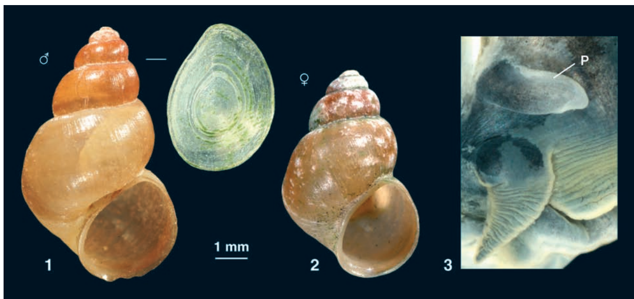
Abb. 3. Pseudobithynia kathrini n. sp. – 1: Holotypus (8.3 mm hoch), 2: Paratypus (6.8 mm hoch), 3: Penis.

nur von P. kathrini erreicht wird. Allerdings unterscheiden sich beide Arten im Verhältnis der Mündungshöhe zur Gehäusehöhe, die nach Angaben LOCARD's bei B. succinea (2.5 : 6 mm) beträgt, das entspricht einem Verhältnis von 0.42. Bei P. kathrini beträgt dieses Verhältnis nur 0.39, d. h. die Mündung ist bei B. succinea im Verhältnis deutlich größer. LOCARD (1894: 121) schreibt auch, dass sie in Farbe und Aussehen einer Succinea oblonga ähnlich ist, was auf keine unserer Arten zutrifft.