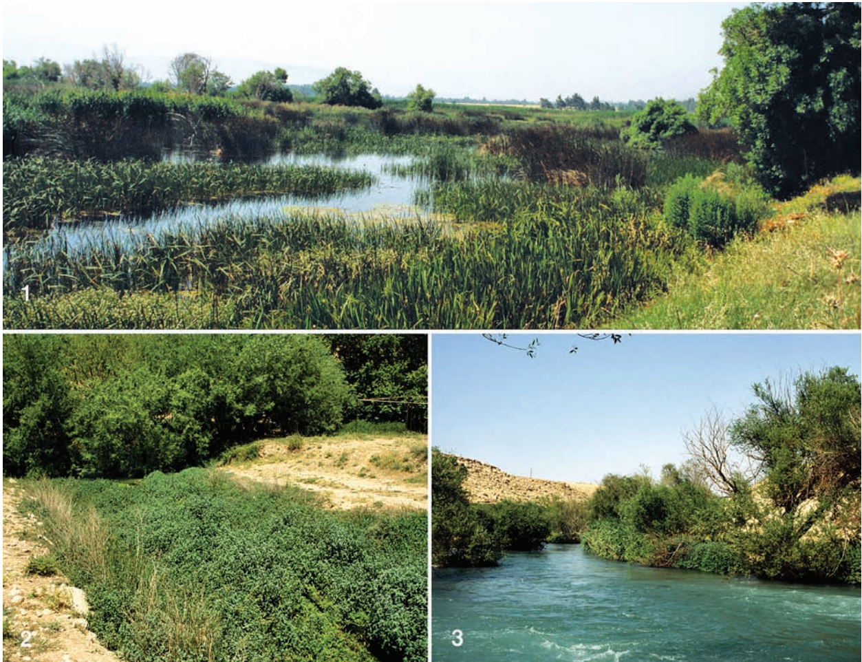
Abb. 2. Die Originalfundorte. 1: Aammiq, 2: Ras el Assi, 3: Hauptlauf Orontes, nahe loc. typ. El Hermel.

dert es nicht, dass im Litani selbst derzeit offenbar nur noch wenige unempfindliche Wassermollusken leben. Zum Litani-Einzugsgebiet gehören ebenfalls einige verkarstete Quellgebiete, die vor allem im Randbereich des Libanon-Gebirges schütten. Das flächenmäßig ausgedehnteste davon befindet sich bei Aammiq (Abb. 2.1). Neben langsam fließenden Gräben prägen einige größere Flachgewässer mit teils gut ausgebildeten Verlandungsröhrichten und Gehölzsäumen das Landschaftsbild. Trotz erheblichen Müll-Eintrags im Zusammenhang mit der Freizeit-Gestaltung der einheimischen Bevölkerung sowie einer nahe gelegenen, relativ stark befahrenen Straße, weisen die Tümpel bei vorwiegend schlammigen, lokal auch sandig-kiesigem Substrat eine relativ gute Wasserqualität auf. Die Begleitfauna der hier in relativ hoher Dichte lebenden Pseudobithynia amiqensis n. sp. wird von typischen Stillwasserbewohnern wie u. a. Lymnaea stagnalis (Linnaeus, 1758), Radix auricularia (Linnaeus, 1758), Gyraulus bekaensis Glöer & Bößneck, 2007 und Musculium lacustre (O. F. Müller, 1774) geprägt. Leergehäuse von Pseudobithynia amiqensis wurden auch im Spülsaum des den Litani aufstauenden künstlichen Sees „Lake Quaraaon“ bei Bab Mareaa gefunden.